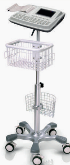
*Soporte pedestal metálico opcional